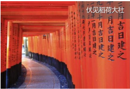
伏见稻荷大社 二月吉日建之 三月吉日建之 四月吉日建之 五月吉日建之 六月吉日建之 七月吉日建之 八月吉日建之 九月吉日建之 十月吉日建之 十一月吉日建之 十二月吉日建之